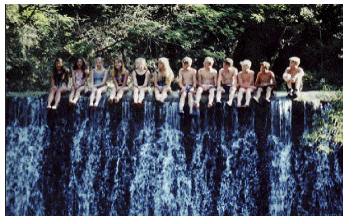
De waterval bij de Ludo Camping.