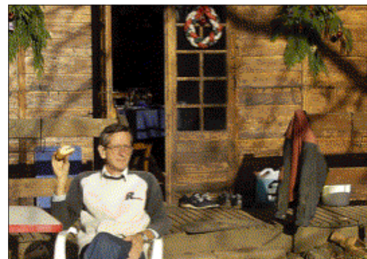
Decemberlunch: Ibele in het zonnetje.