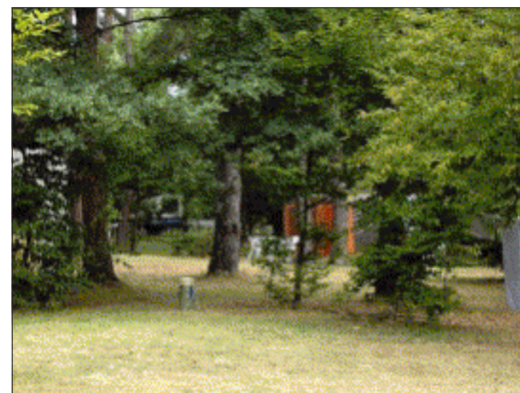
Kamperen in het park bij Champ de la Chapelle.