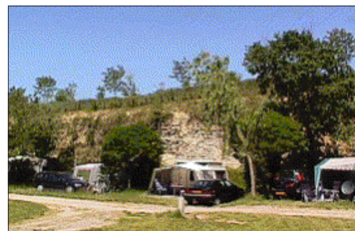
De Ludo Camping in de Ardèche.